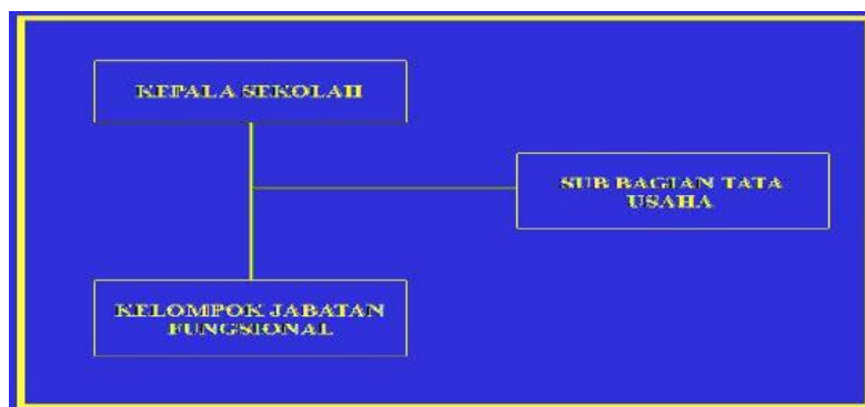
Gambar 1 Struktur Organisasi

Melakukan kegiatan sesuai dengan jabatan fungsional masing-masing berdasarkan Peraturan Perundang-undangan yang berlaku.